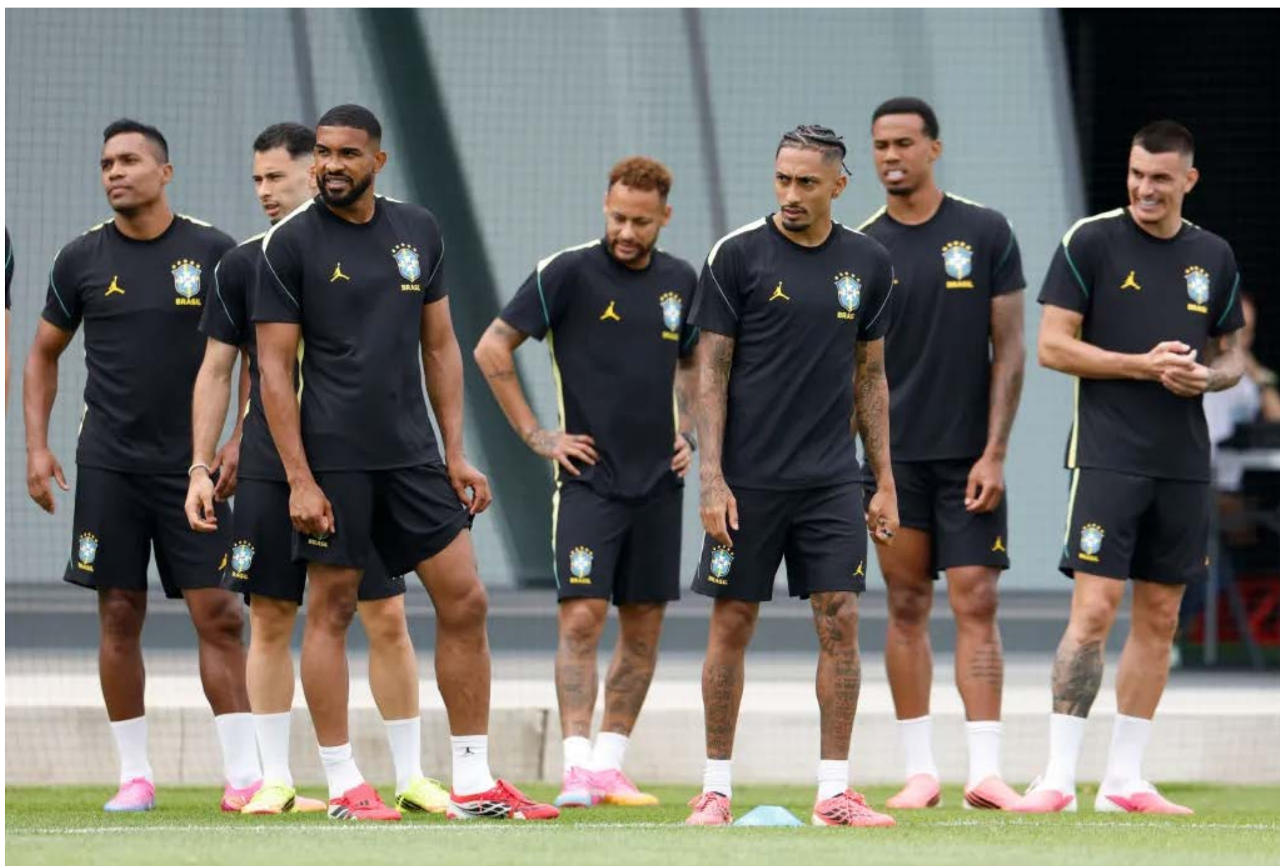
Neymar treina e pode estreiar contra a Escócia (©Rafael Ribeiro/CBF - imagem do treinamento da semana passada)

Brasil tem pela frente a Escócia, no último jogo da fase de grupos