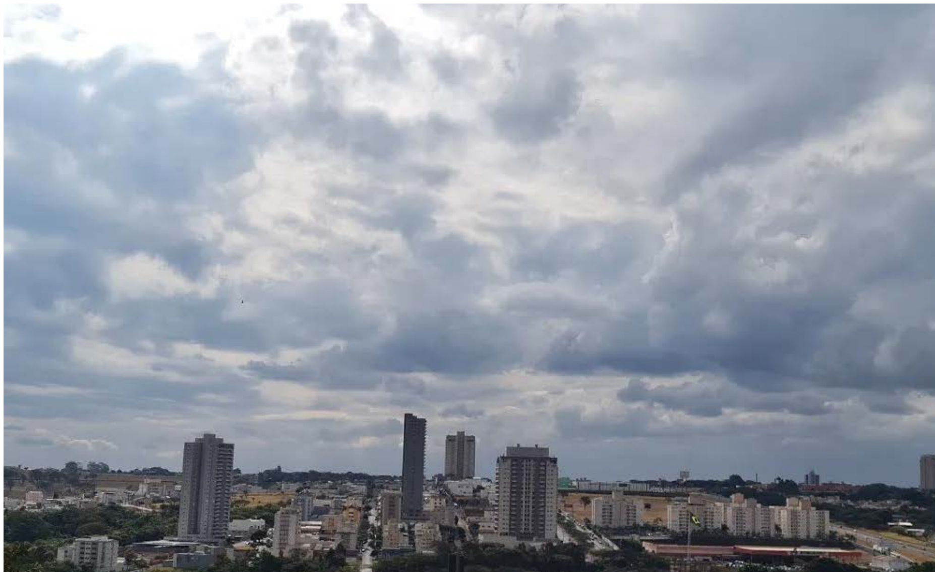
Massa de ar polar vinda do Sul avança sobre parte da Região Sudeste e outras localidades

Confira a previsão meteorológica do Instituto Climatempo