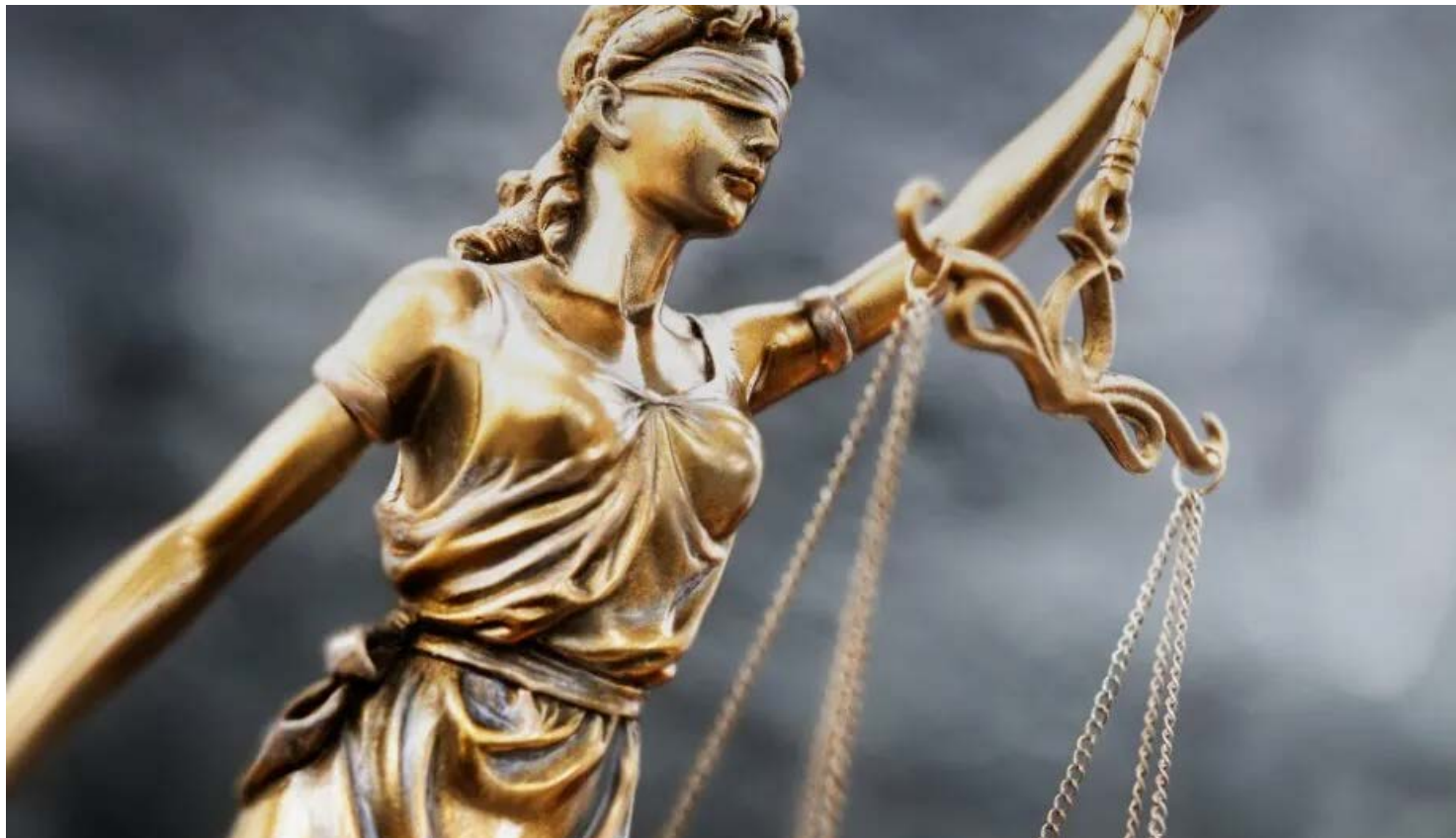
Mantida condenação de homem por injuriar a mãe em razão de religião

Para o relator do recurso, desembargador Guilherme de Souza