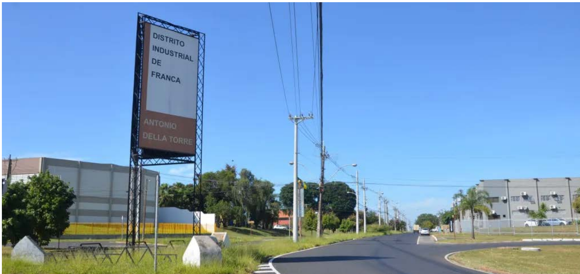
Distrito Industrial terá alteração na coleta de lixo

Moradores devem disponibilizar os resíduos para coleta com antecedência, atentando-se aos novos horários