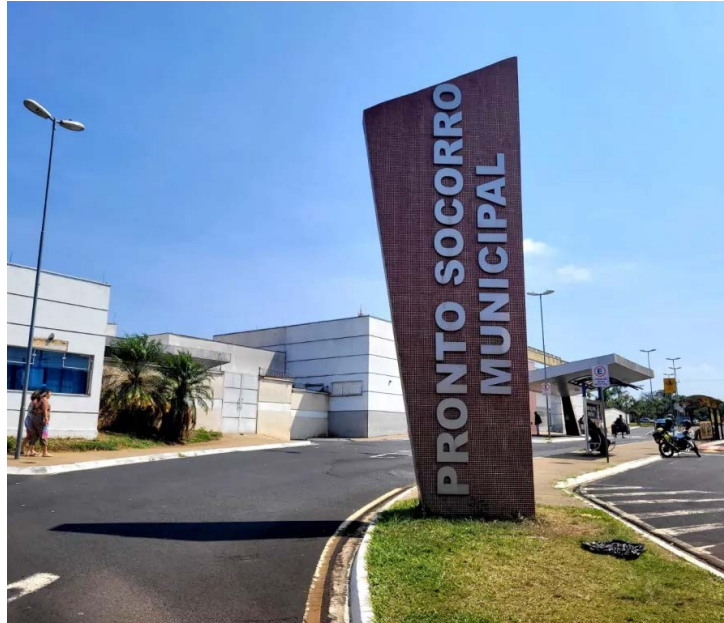
Pronto Socorro Municipal Dr. Álvaro Azzuz