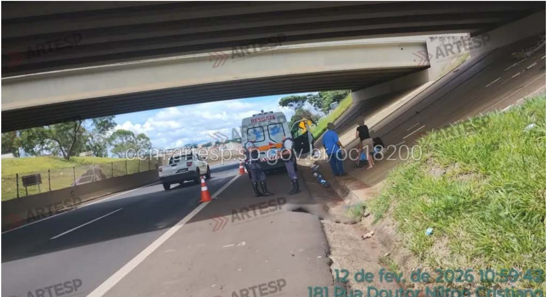
Viaduto localizado no Km 339 da Rodovia Cândido Portinari, região onde se deu o ocorrido

Fato aconteceu na manhã desta quinta-feira, 12