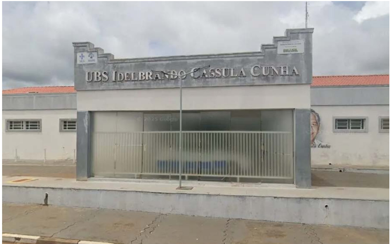
UBS Idelbrando Cassula Cunha