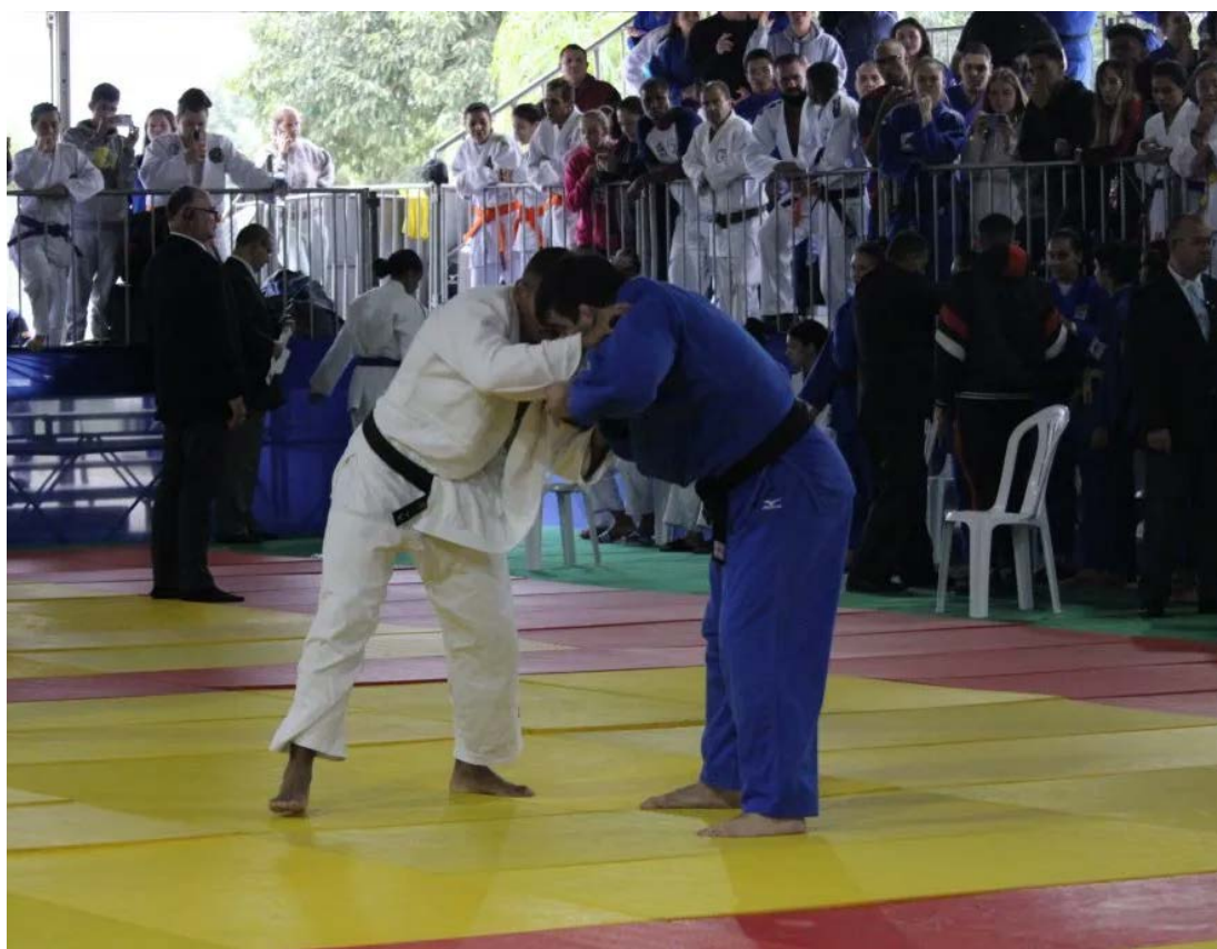
Tatame dos Campeões oferece aulas gratuitas de judô a 60 alunos com idade entre 7 e 17 anos

peões fala muito mais do que aulas de judô. Fala de formação de pessoas, de oportunidades e de futuro. Nós acreditamos que o esporte transforma realidades. E este projeto é exatamente isso: um espaço onde sonhos começam, valores são construídos e o esporte cumpre sua