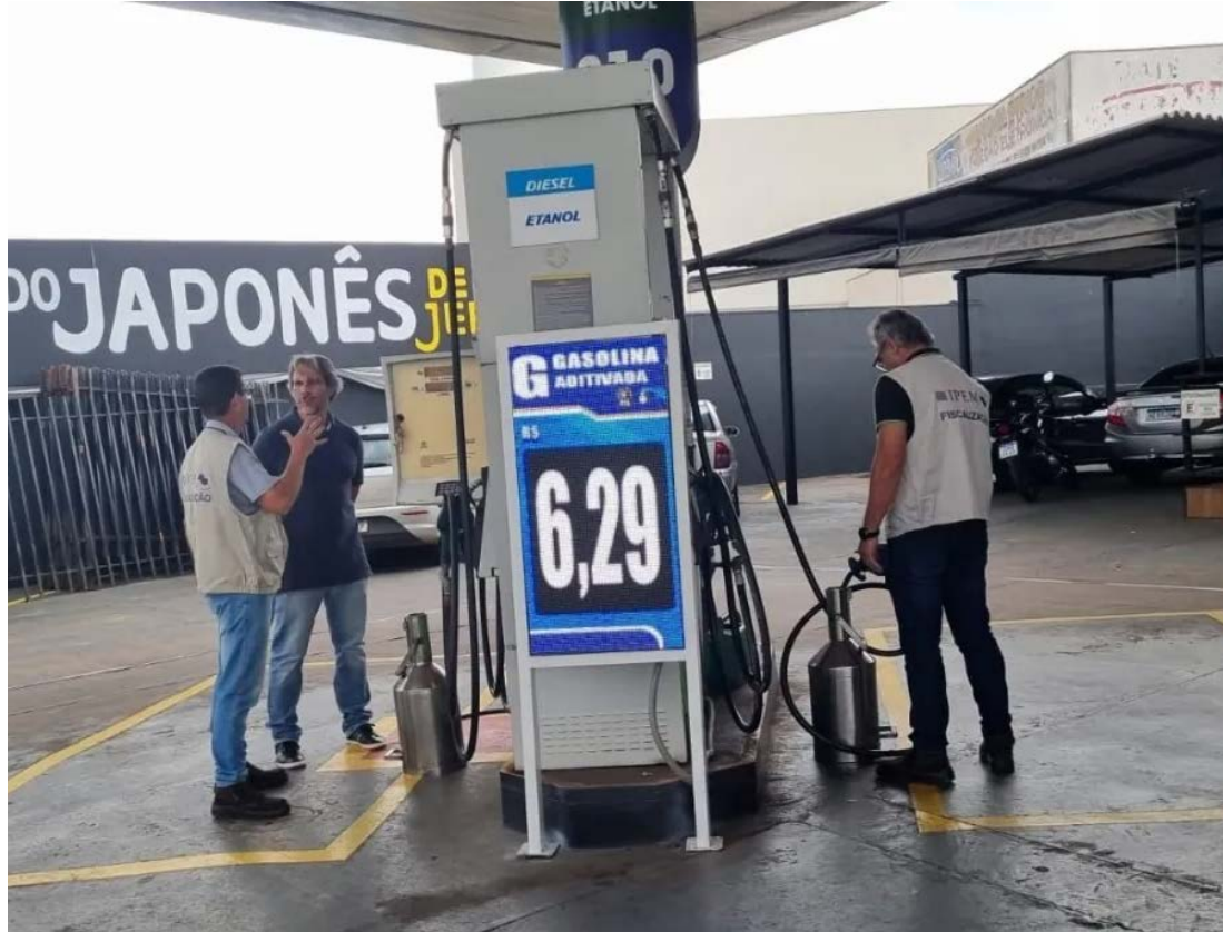
Em Franca, Ipem-SP integra força-tarefa em posto de combustível

Ipem-SP encontram bombas medidoras de combustíveis com indícios de fraude, após apreensão dos componentes eletrônicos e interdição das mesmas, os fiscais identificam qual é a permissionária que presta serviço no estabelecimento, e então, é feito um levantamento nas atividades realizadas por esta permissionária, não só neste posto como também em outros postos, e caso seja constatada alguma irregularidade em relação a prestação de serviço e ao não atendimento ao Regulamento Técnico Metrológico a que estão sujeitas, é aberto um processo administrativo propondo o descredenciamento da permissionária. Detecta-