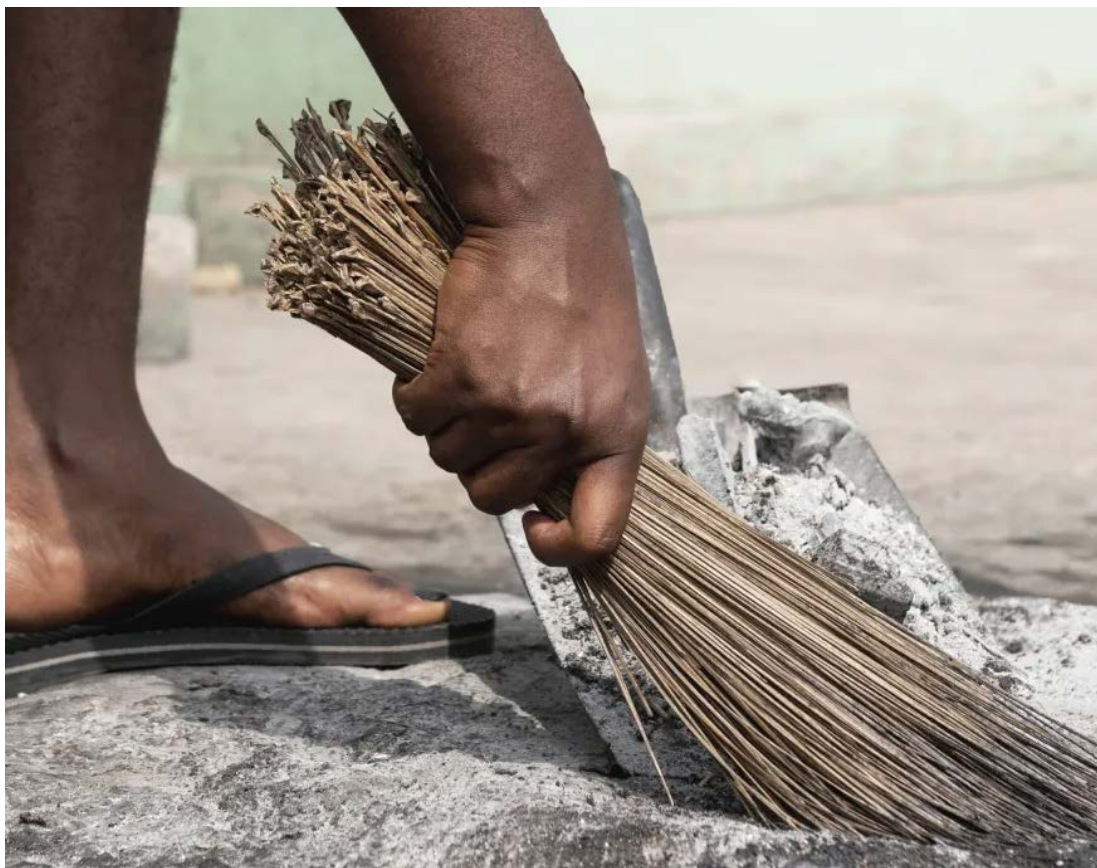
No dia 28 de janeiro, a sociedade celebrou o Dia Nacional de Combate ao Trabalho Escravo