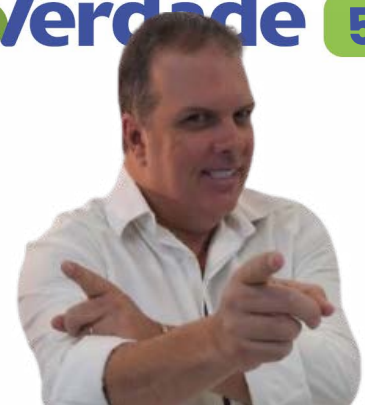
Por Lucas Verzola