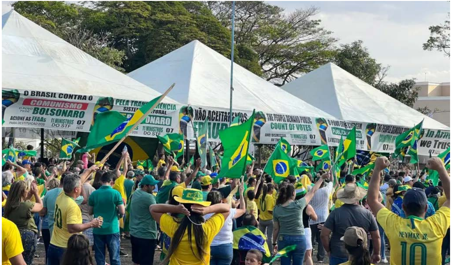
Ato é identificado como "A Favor da Anistia e Contra a Corrupção"