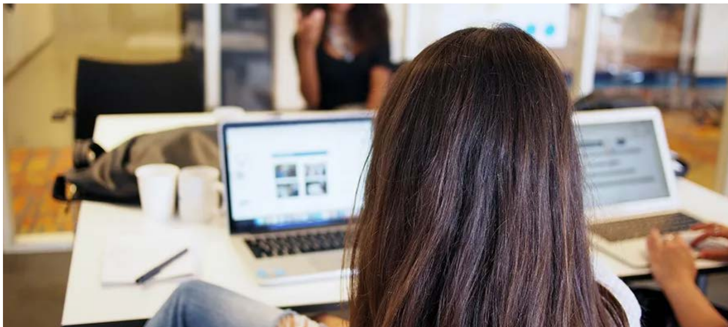
Na região de Franca, em 2025, foram abertas 5.398 novas empresas

“O estado de São Paulo tem vocação e potenciais gigantes para gerar novas empresas. Há boa logística, mercado consumidor robusto, ambiente de negócios favorável, entre outras características. Estamos desburocratizando cada vez mais o processo de abertura, como determina o governador Tarcísio de Freitas, para que os