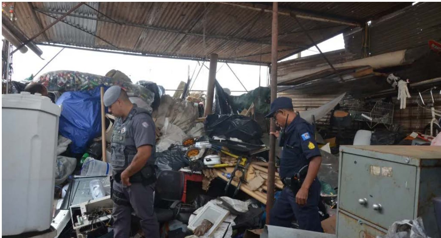
Operação Ferro-Velho

Na mesma ocasião, também houve a fiscalização de comércios noturnos, cuja operação se estendeu a outros estabelecimentos, com ênfase em adegas que funcionavam sem a devida regularização. Um destes