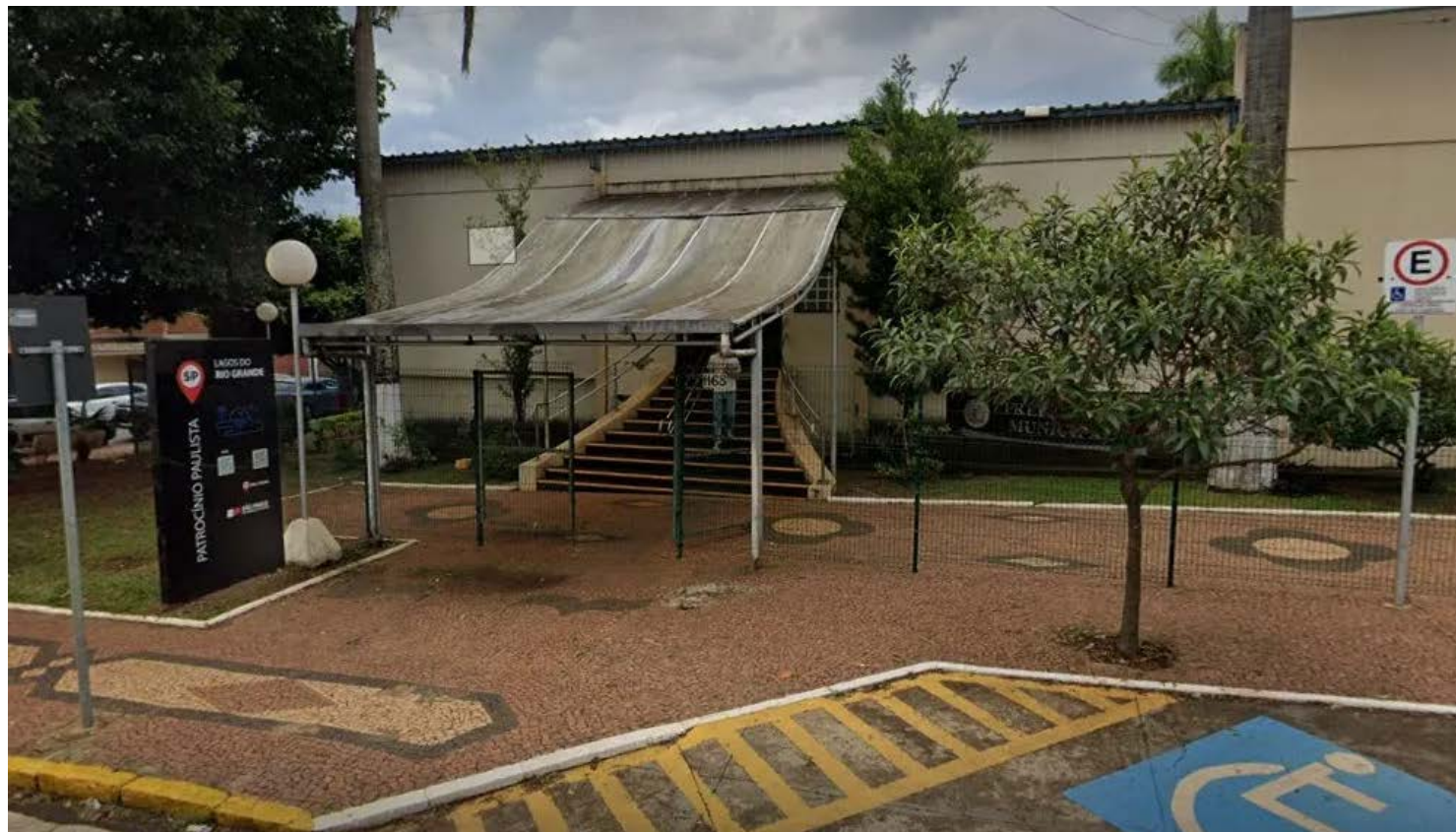
Prefeitura Municipal de Patrocínio Paulista

Com relação aos pedidos de indenização mencionados na ação ci-