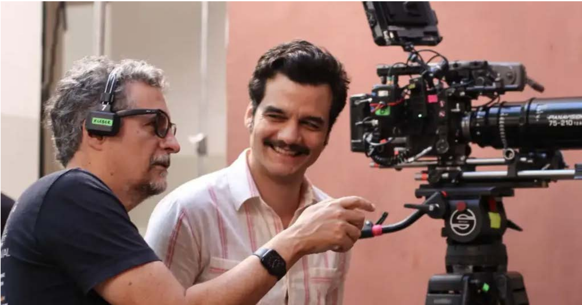
Wagner Moura, em gravação de O Agente Secreto