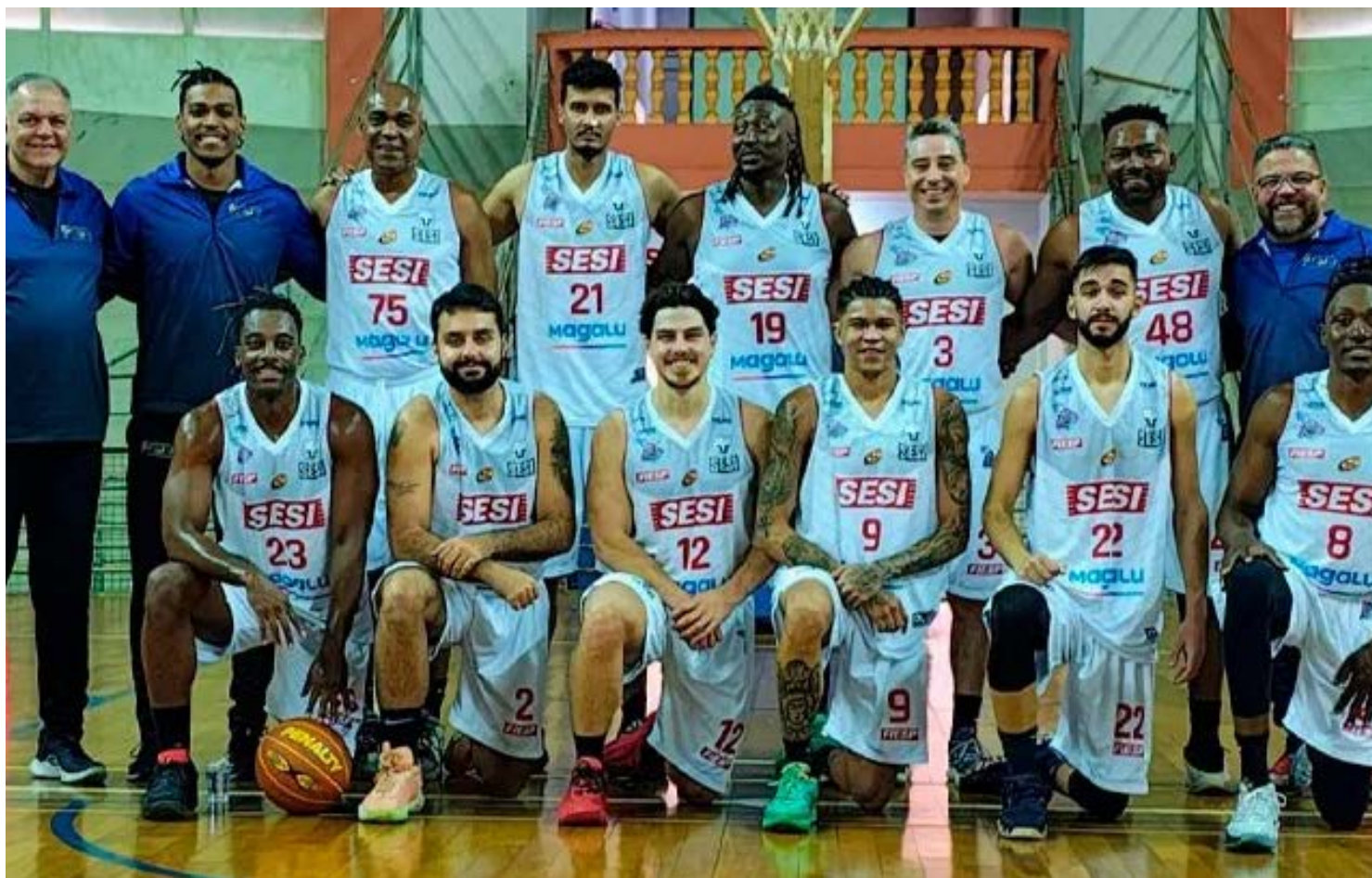
Franca levou a melhor em 20 disputas e acumulou 325 pontos na classificação geral

“Franca vem fazendo um grande trabalho no esporte, especialmente na base, com as equipes sub-21. Nossa comissão técnica já previa esses resultados. A inclusão do basquete 3x3 na programação foi muito boa porque Franca tem tradição na modalidade”, comenta Mateus Caetano. Franca de fato dominou o basquete 3x3 em Ribeirão Preto, ven-