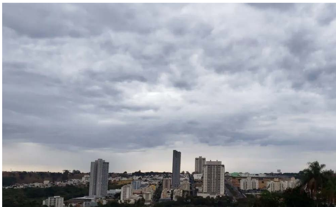
Chuva na terça, frio na quarta: confira a previsão do tempo

previsto 40% de chances de chuva para esta terça-feira, de até 0.1mm. Faz sol com