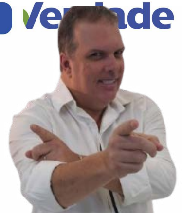
Por Lucas Verzola